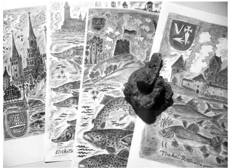
Spalvoti paveikslėliai ir „meteoritas“.